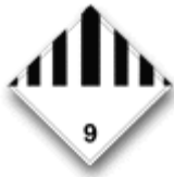
Rótulo peligro principal